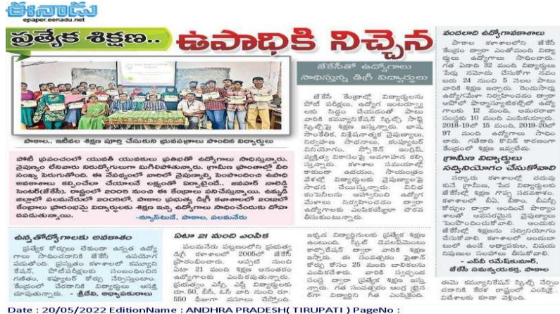
Date : 20/05/2022 EditionName : ANDHRA PRADESH (TIRUPATI ) PageNo :