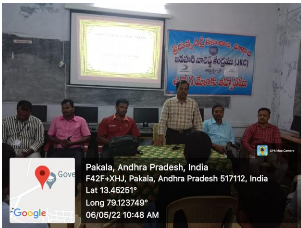
Pakala, Andhra Pradesh, India F42F+XHJ, Pakala, Andhra Pradesh 517112, India Lat 13.45251° Long 79.123749° 06/05/22 10:48 AM