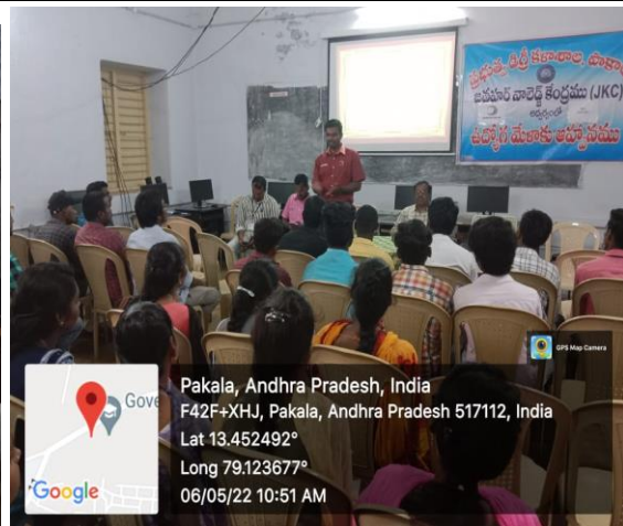
Pakala, Andhra Pradesh, India F42F+XHJ, Pakala, Andhra Pradesh 517112, India Lat 13.452492° Long 79.123677° 06/05/22 10:51 AM