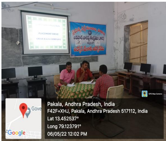
Pakala, Andhra Pradesh, India F42F+XHJ, Pakala, Andhra Pradesh 517112, India Lat 13.452537° Long 79.123791° 06/05/22 12:02 PM