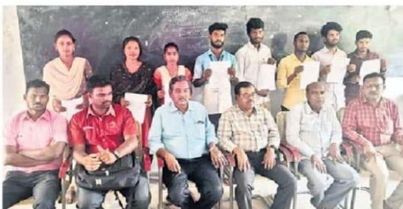
ఉద్యోగాలకు ఎంపికైన విద్యార్థులు